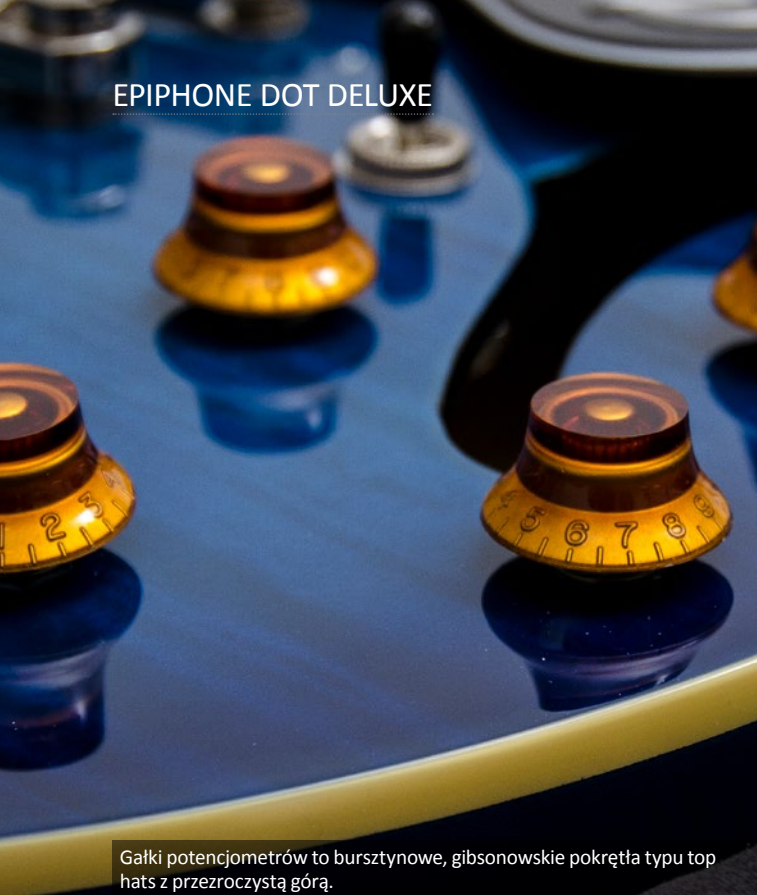
Gałki potencjometrów to bursztynowe, gibsonowskie pokręta typu top hats z przezroczystą górą.