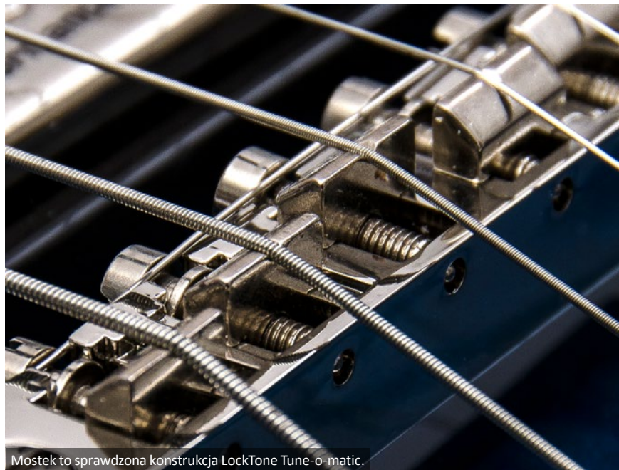
Mostek to sprawdzona konstrukcja LockTone Tune-o-matic.