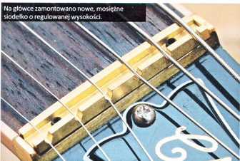
Na główce zamontowano nowe, mosiężne siodełko o regulowanej wysokości.