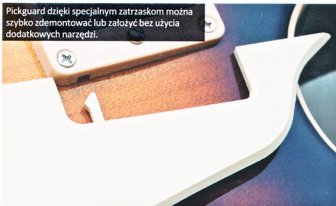
Pickguard dzięki specjalnym zatrzaskom można szybko zdemontować lub założyć bez użycia dodatkowych narzędzi.