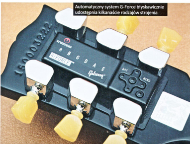
Automatyczny system G-Force błyskawicznie udostępnia kilkanaście rodzajów strojenia

otrzymujemy efektywnie prezentujący się, nowo opracowany złoty futerał, zapewniający bardzo dobrą szczelność oraz chroniący instrument nawet przy upadku z dużej wysokości.