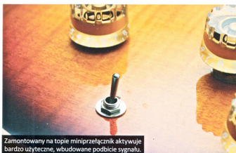
Zamontowany na topie miniprzelącznik aktywuje bardzo użyteczne, wbudowane podbicie sygnału.