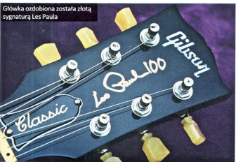
Główka ozdobiona została złotą sygnaturą Les Paula