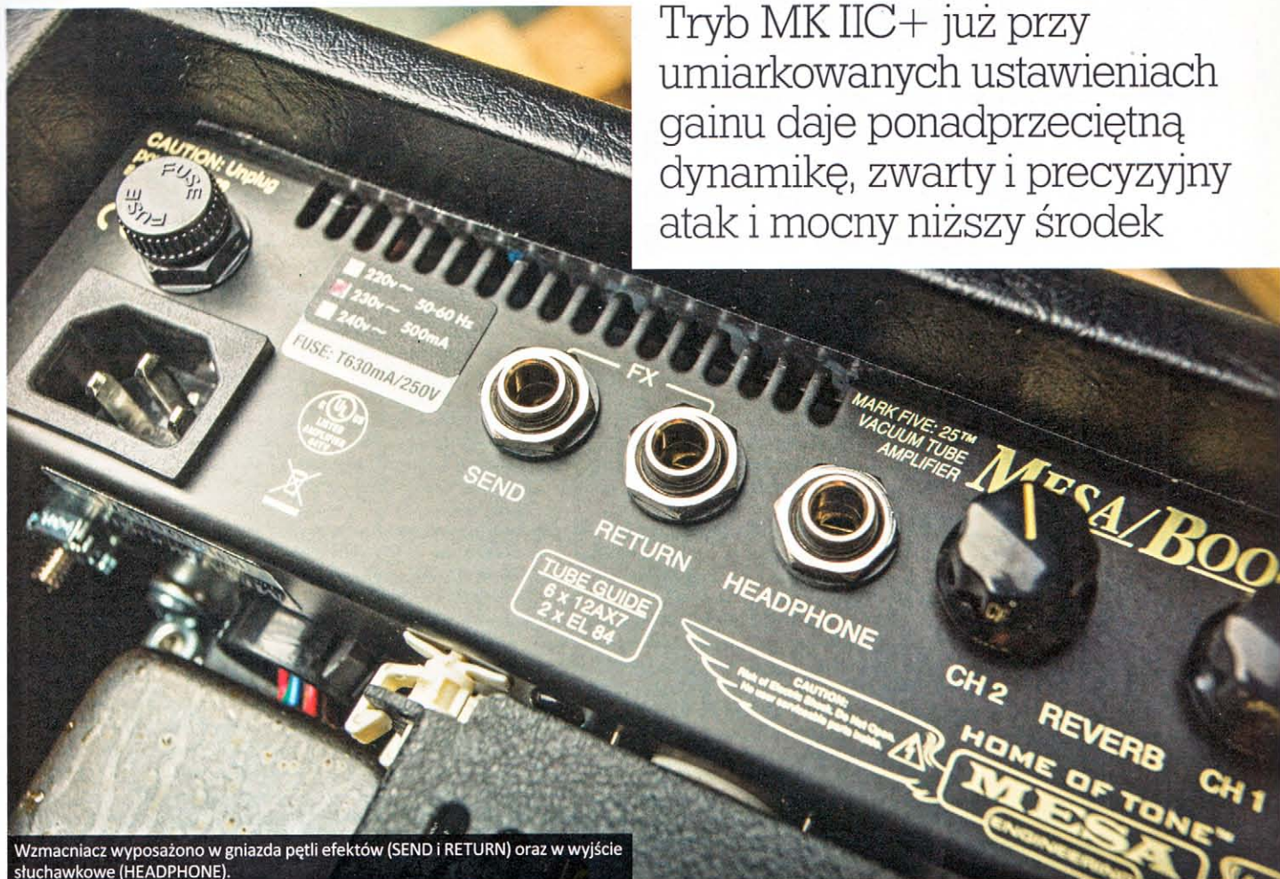
Wzmacniacz wyposażono w gniazda pętli efektów (SEND i RETURN) oraz w wyjście słuchawkowe (HEADPHONE).

Tryb MK IIC+ już przy umiarkowanych ustawieniach gainu daje ponadprzeciętną dynamikę, zwarty i precyzyjny atak i mocny niższy środek