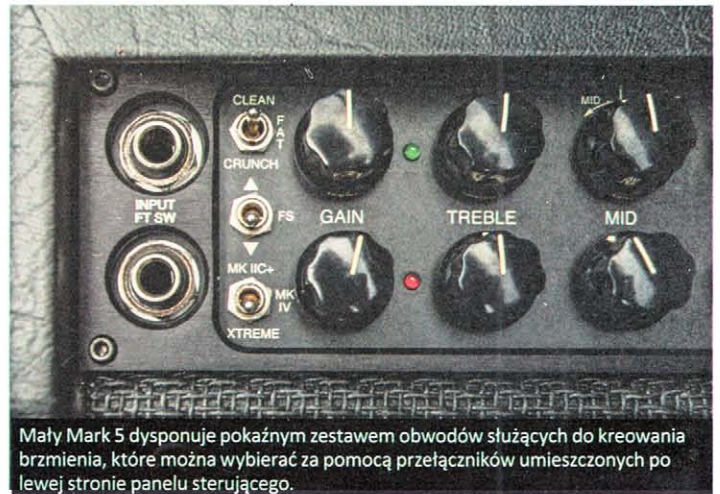
Mały Mark 5 dysponuje pokazanym zestawem obwodów służących do kreowania brzmienia, które można wybierać za pomocą przełączników umieszczonych po lewej stronie panelu sterującego.

szerokie spektrum brzmień bez dotykania wzmacniacza. Sprawdźmy teraz możliwości, jakie oferuje kanał 2. Jest on przeniesiony z Marka 5, gdzie ukrywał się pod nazwą Channel 3. Kanał ten oferuje trzy tryby pracy: MK IIC+, MK IV i Xtreme. Pierwszy z nich bazuje na obwodzie Lead kultowego Marka IIC+, drugi oparto na wzmacniaczu Mark IV, natomiast trzeci to maksymalna dawka mocy dla miłośników hi-gainu. Tryb MK IIC+ już przy umiarkowanych ustawieniach gainu daje ponadprzeciętną dynamikę, zwarty i precyzyjny atak i mocny niższy środek. Uwagę zwraca doskonały sustain i miła dla ucha kompresja, co czyni z tego trybu idealne narzędzie do partii solowych. Tryb MK IV to jeszcze większa saturacja, mocniejszy dół pasma i bardziej wycofany wyższy środek. To brzmienie