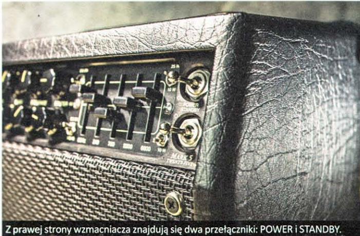
Z prawej strony wzmacniacza znajdują się dwa przełączniki: POWER i STANDBY.