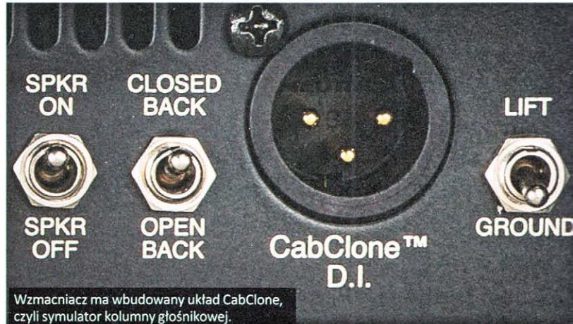
Wzmacniacz ma wbudowany układ CabClone, czyli symulator kolumny głośnikowej.