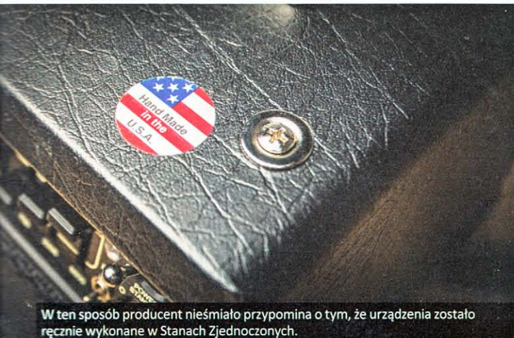
W ten sposób producent nieśmiało przypomina o tym, że urządzenia zostało ręcznie wykonane w Stanach Zjednoczonych.